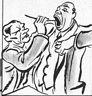
und die Blauband, besänftigt sie