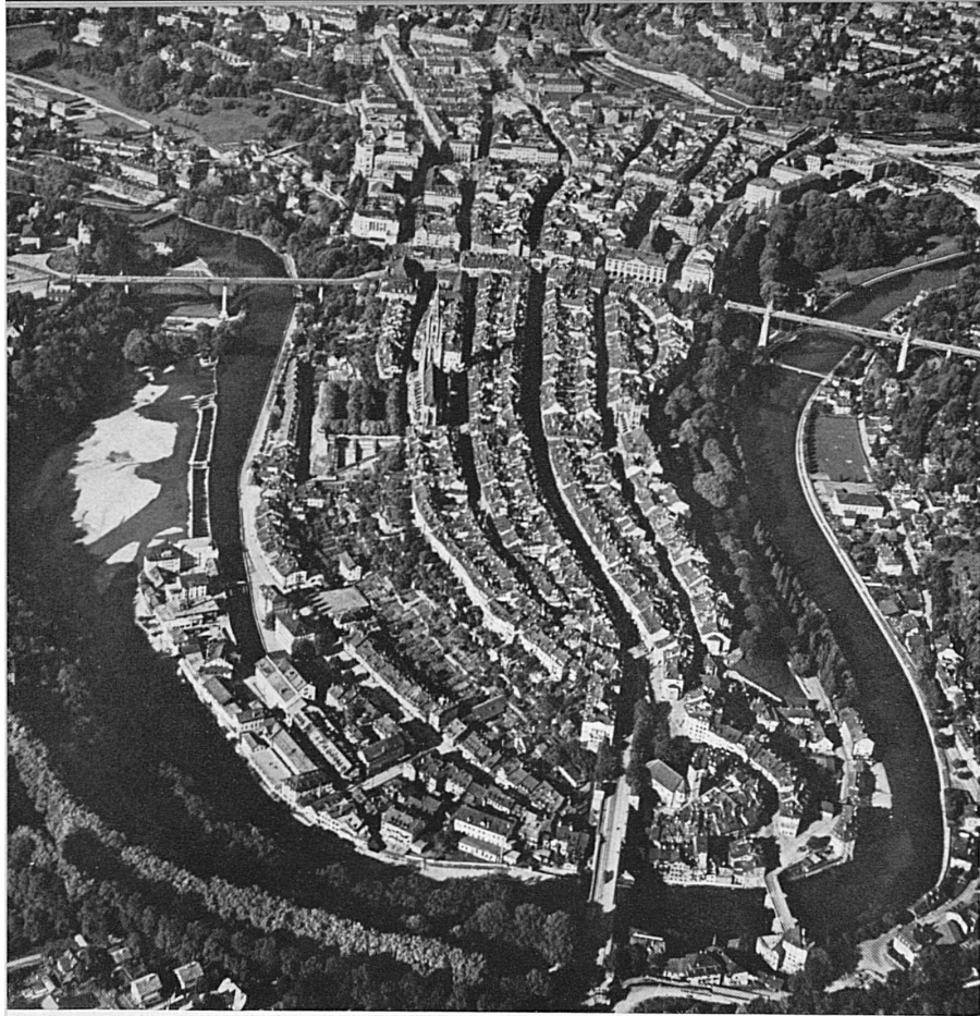
Left: Old Bern from the air. — A gauche: Le vieux Bern à vol d'oiseau — Links: Das alte Bern vom Flugzeug aus Below: The Moses Fountain and Minster Spire — En bas: La fontaine de Moïse et la Tour de la Cathédrale — Unten: Mosesbrunnen und Münsterturn