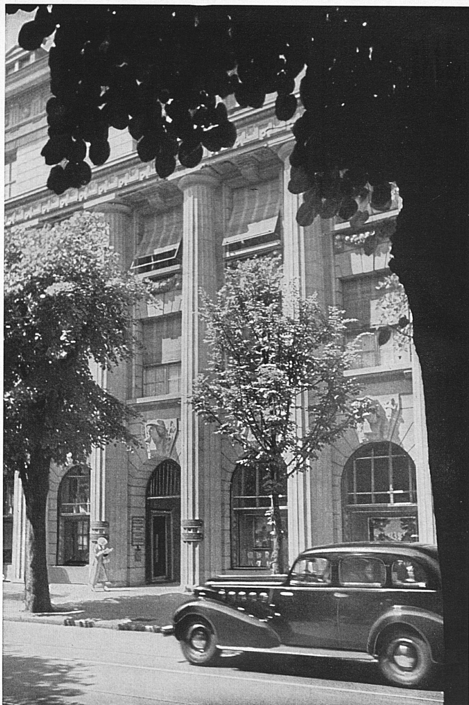
Eingang zum Bankgebäude in Zürich

Die Beteiligung an der Schweizerwoche verursacht der Produktion und dem Handel keine allzugrossen Kosten und Umtriebe. Der Käufer, die oberste Instanz im Prozess der Güterproduktion und des Güterumlaufs, wird auf gewohnten Verbindungswegen erreicht, die Schweizerwoche zeigt ihm die örtlichen Bezugsquellen für Schweizerware, sie orientiert ihn darüber, was sein bevorzugter Lieferant in einheimischer Auswahl zu bieten hat. Die Stärke der Schweizerwoche liegt zweifellos auch im Patriotisch-Ethischen. Sie stellt den einzelnen vor die Frage seines Verhaltens gegenüber dem Mitbürger, sie hat erreicht, dass grosse und sonst gegensätzliche Erwerbsgruppen alljährlich zusammentun, um einer nationalen Gemeinschaftsidee zu dienen. Dieses Zusammengehen kommt in der einheitlichen Schlichtheit des äusseren Gepräges zwar nicht zu imposanten, wohl aber zu einem für den Einsichtigen erhebenden Ausdruck: Wer während der Schweizerwoche das Land bereist und die Städte und Dörfer der Heimat vom Lemán bis zum Bodan durchwandert, den grüsst allüberall das gleiche eine Zeichen unserer wirtschaftlichen und schicksalhaften Verbundenheit, das Zeichen für Schweizerware, für das Werk eigener Leistung.