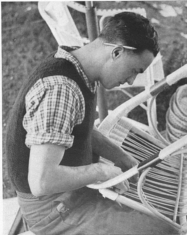
Travaux et fêtes du peuple tessinois