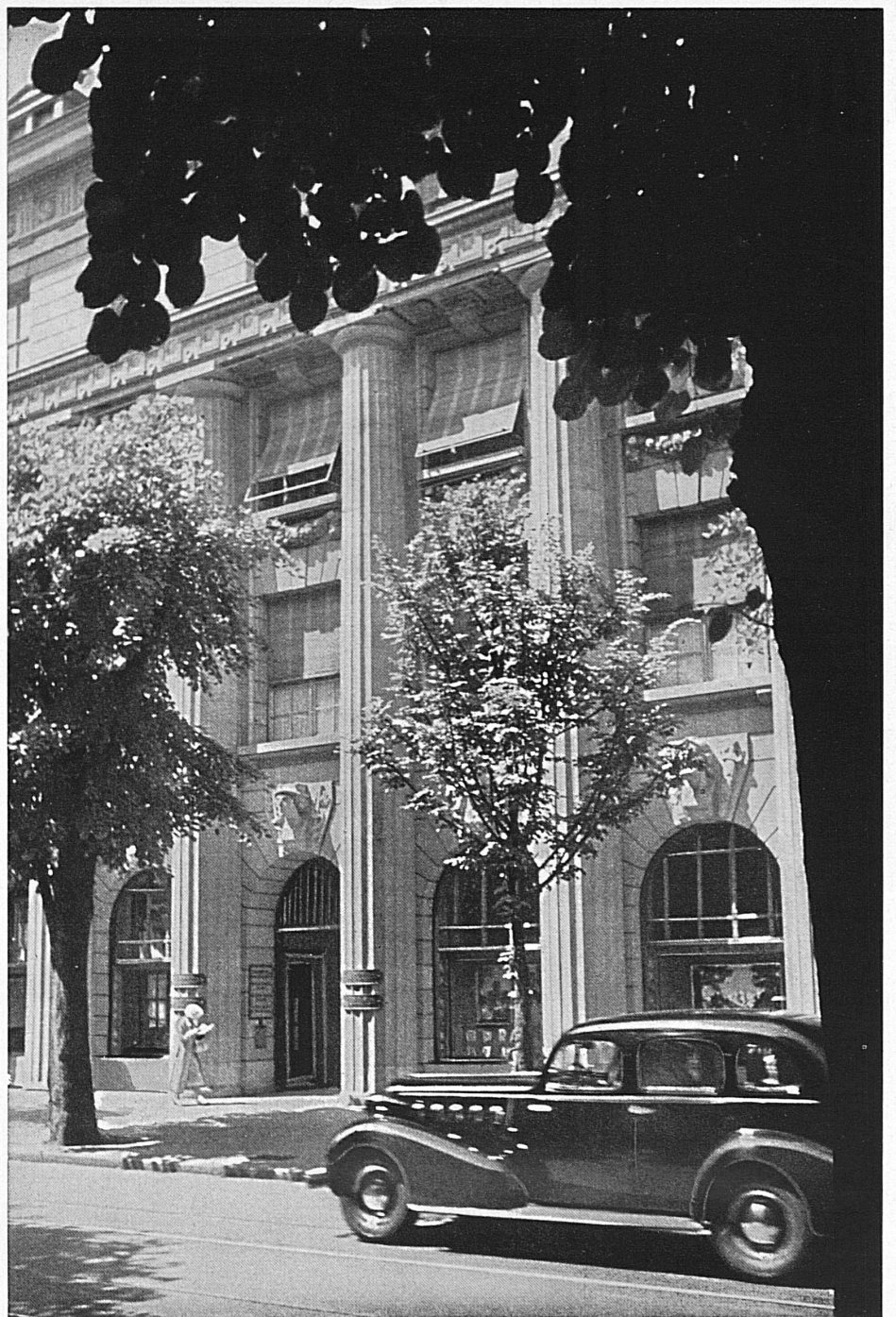
Eingang zum Bankgebäude in Zürich

Der Verlag Otto Walter in Olten hat das Jahr der Schweizerischen Landesausstellung mit der Herausgabe eines grossen Prachtwerkes gefeiert, das dem verlegerischen Geschick und der drucktechnischen Leistungsfähigkeit dieser bedeutenden Firma ein hervorragendes Zeugnis ausstellt und als eine Art «Summa» schweizerischer Landschaft und Kultur angesprochen werden kann. An dem Buch «Die Schweiz, mein Land» haben drei Mitglieder unserer obersten Landesbehörde — Bundespräsident Etter und die Bundesräte Motta und Obrecht — hohe Offiziere unserer Armee, Dichter und Schriftsteller aller vier Sprachgebiete, führende Köpfe der Wissenschaft, der Wirtschaft, des Reiseverkehrs und der Technik, hervorragende Kenner sozialer Bestrebungen und Fachleute des Sportes mitgearbeitet. Eine Unsumme von interessantem Material, von Forschungsergebnissen und von Erfahrungen des praktischen Lebens ist in dem Werk verarbeitet, in der mehrsprachigen Vielgestaltigkeit, die unser nationales Leben auszeichnet. Dazu ist nun aber der monumentale Band auch ein Schweizer Bilderbuch, wie es wohl kein zweites gibt, mit farbigen Tafeln und Hunderten von Aufnahmen, zu deren Auswahl man dem Verlag das grösste Kompliment machen muss. «Die Schweiz, mein Land» wird im Jahre der Landesausstellung ein ganz besonders wertvolles Weihnachtsgeschenk sein.