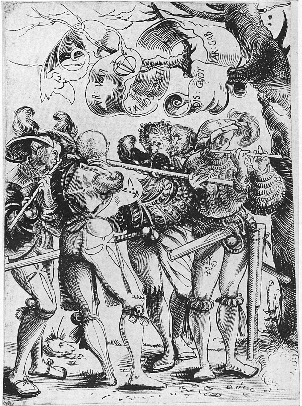
Urs Graf, «Das Flötenständchen», Federzeichnung im Basler Kupferstichkabinett.

Highlanders, resta très populaire jusqu'en plein 17 me siècle. Les trompettes formaient au Moyen âge déjà, et jusqu'au 18 me siècle, une profession de choix; tout gouvernement qui se respectait possédait ses hérauts, portant grade d'officiers. Un fragment de vitrail du 16 me , conservé au Musée historique de Bâle, nous montre, dans une colonne militaire débouchant au Spalontor, un de ces hérauts portant l'écu et à sa trompette le gonfanon de la cité. Les soudards suisses préféraient toutefois les fifres et tambours, dont de forts contingents accompagnaient les troupes en campagne, et se faisaient applaudir à l'étranger. Les fifres courts, précurseurs du piccolo, portaient partout le nom de « fifres suisses ». Le tambour long est actuellement encore désigné en Angleterre sous le nom de « Swiss drum ». Urs Graf nous dépeint l'une de ces cliques de tambours et fifres dans leur magnifique accoutrement de deux couleurs mi-