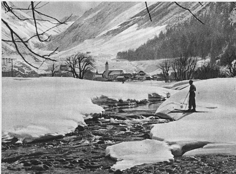
Andermatt en Suisse centrale — Andermatt in Central Switzerland — Andermatt am Gotthard, im Herzen der Schweiz