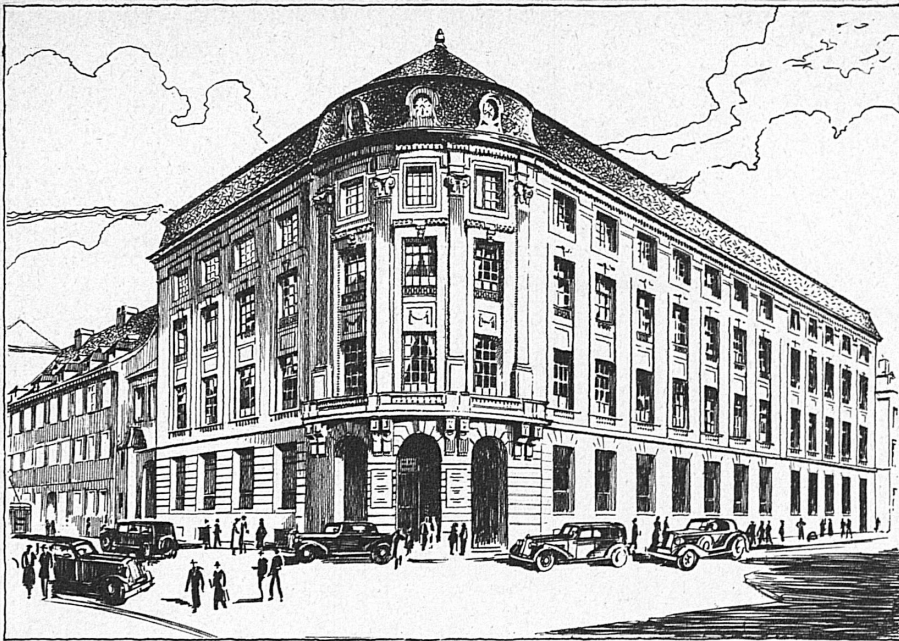
Gesellschaftssitz in Basel - Siège social à Bâle