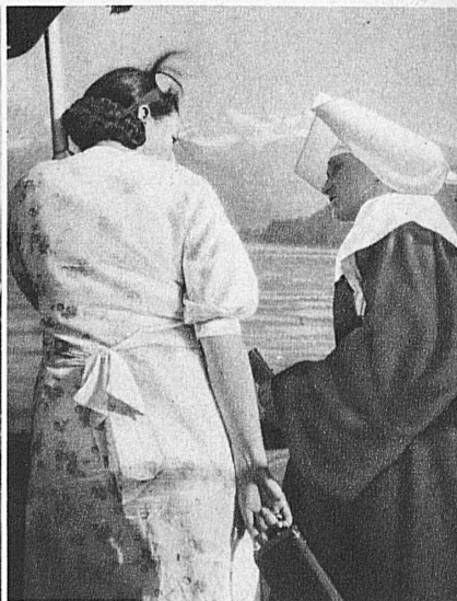
Fahrt auf dem Thunersee — Sur le lac de Thoune