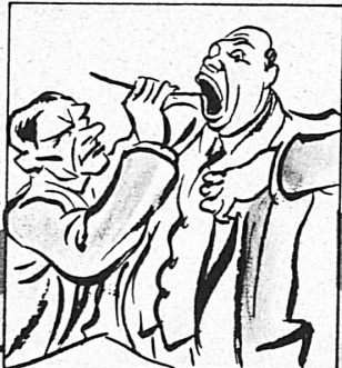
und die Blauband besänftigt sie