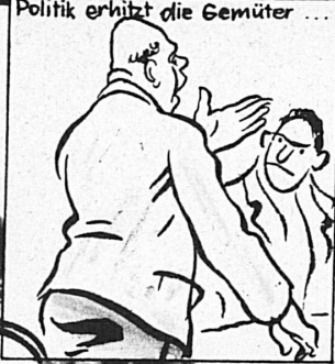
Politik erhitzt die Gemüter ...