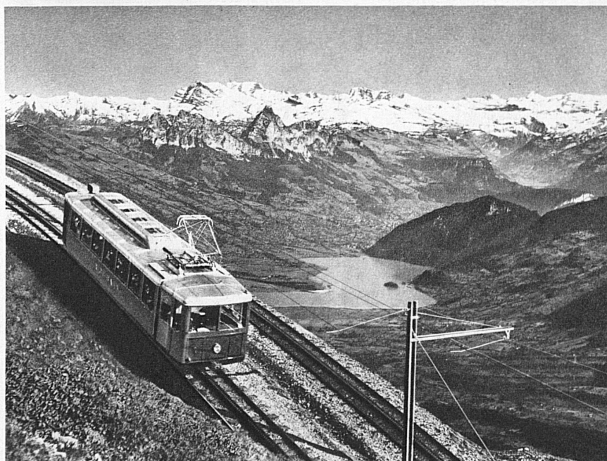
Die zahlreichen Bergbahnen ermöglichen, abwechslungsweise den Bergfrühling und den Seenfrühling zu geniessen. Die Rigibahn in der Zentralschweiz

Der Gegensätze ... denn der Mensch, der die blühenden Gebiete durchwandert, braucht nur das Auge zu erheben, und wieder leuchten ihm die Firne der Hochalpen entgegen; er braucht nur eine der vielen Bergbahnen zu besteigen, um dieses unvergessliche dramatische Erlebnis zu finden: die Gleichzeitigkeit der Jahreszeiten, den unvergleichlichen Wechsel von Schnee und Blütenpracht, winterlicher Herbe und frühlingshafter Milde im Bild der schweizerischen Frühlingslandschaft.