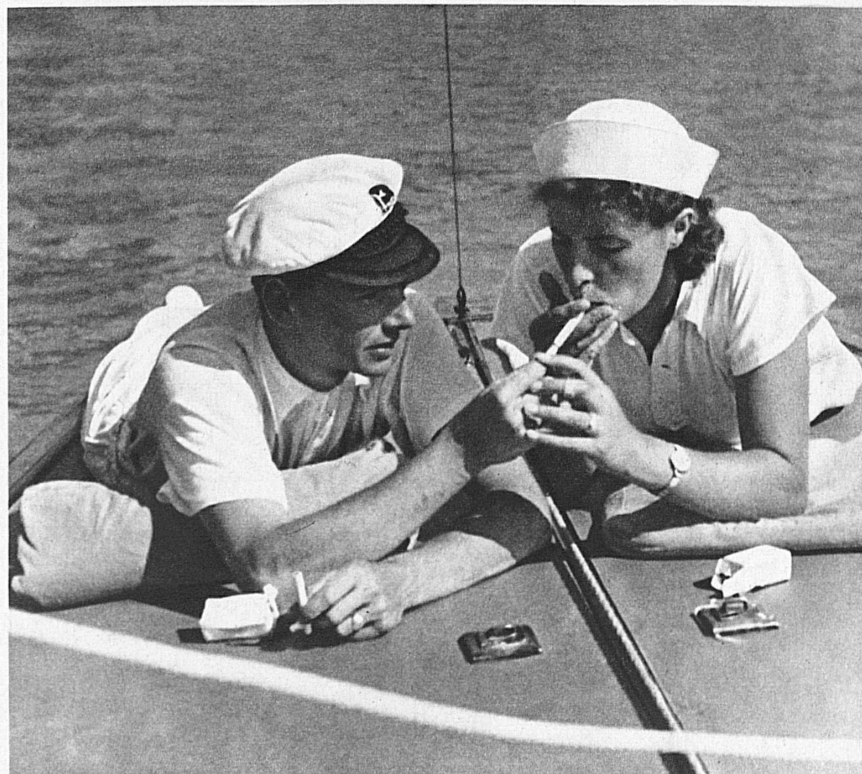
Früh beginnt am Thunersee der Betrieb der Segelschule, die in verschiedenen Uferkurorten stationiert ist