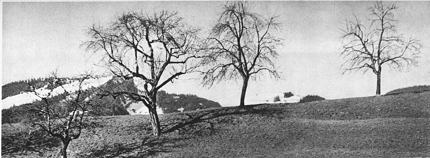
Einen wunderbaren Reiz hat der Vorfrühling in den Hügel- und Voralpengebieten der Schweiz. Märzstimmung in der Ostschweiz