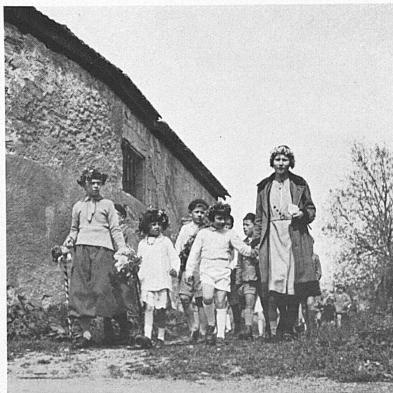
Rechts: Auch mit der Schule geht es jeden Sommer einmal auf die Reise. — A droite: Chaque été les classes s'en vont un beau matin vers les plus beaux sites de la patrie