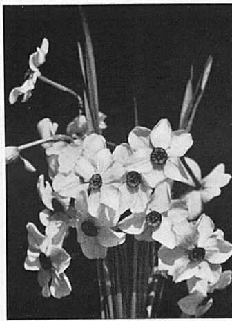
Gelbe Alpenanemone, blauer Enzian, Soldanelle und Narzisse, holde Frühlingsblumen von der Alp und von den Seeuferhöhen des Léman — Anémones, gentianes, soldanelles et narcisses, messagers du printemps alpin et du printemps lémanique