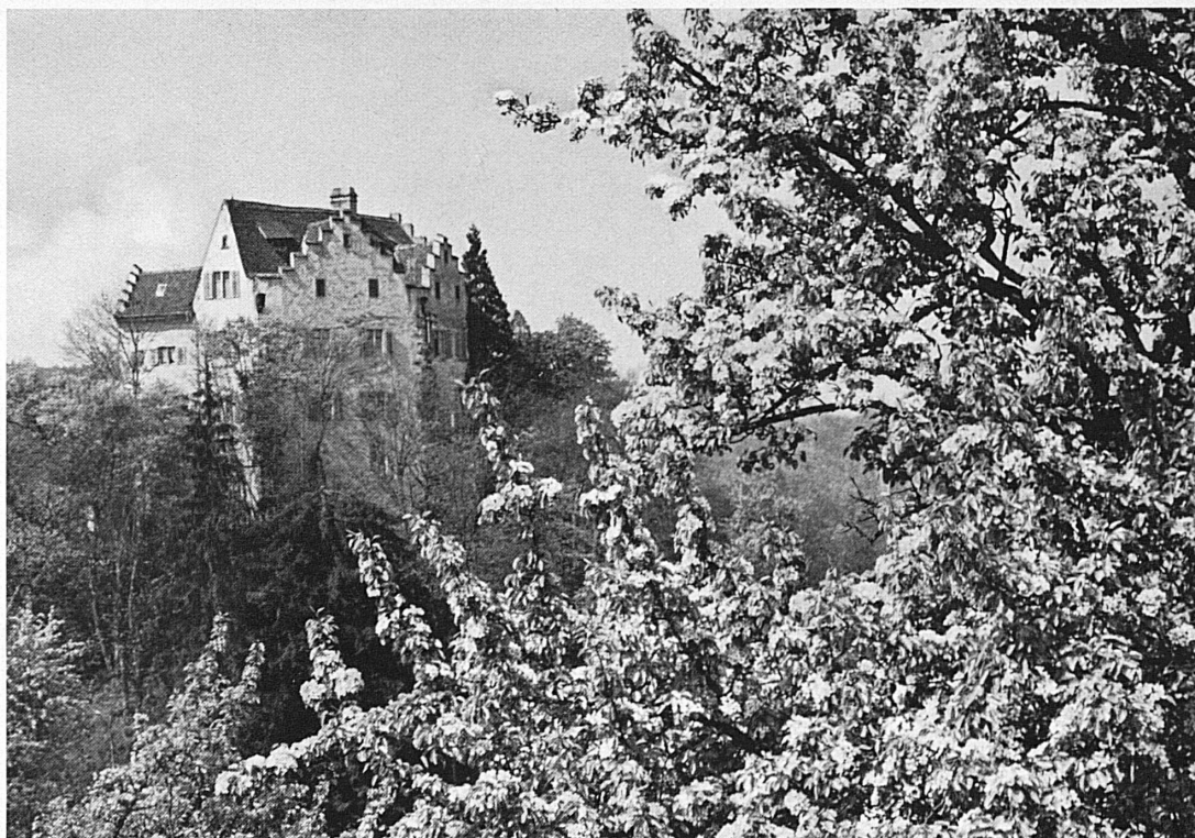
*) Schloss Salenstein im blühenden Thurgau — Le château de Salenstein en Thurgovie