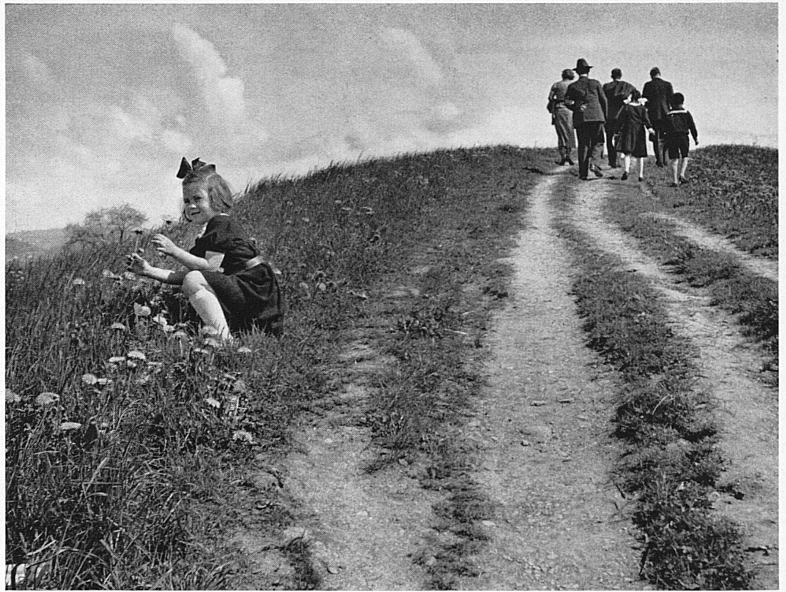
Sonntagsspaziergang über weite Höhen — Promenade du dimanche à travers les champs