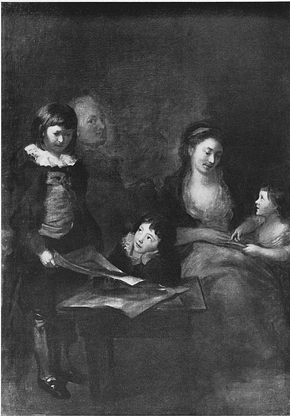
Anton Graff (1736—1813). La famille de l'Artiste . Propriété du Musée de la ville de Winterthour Anton Graff (1736—1813). Die Familie des Künstlers , gemalt im Jahr 1786. Besitz des Museums der Stadt Winterthur