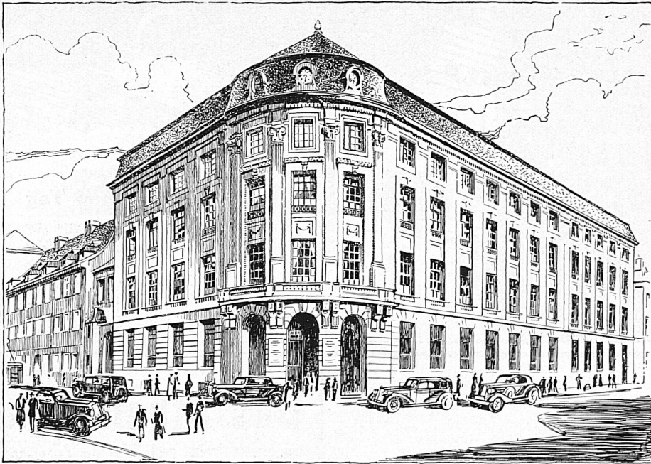
Gesellschaftssitz in Basel - Siège social à Bâle