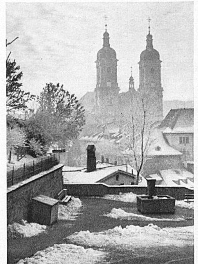
St. Gallen im Schnee – St-Gall sous la neige

Bei Lösung am Samstag oder Rückfahrt am Montag sind die bisherigen Sonntagsbillette lt. Tarif zu lösen. Die Züge verkehren fahrplanmässig ab 1. November bis Rigi-Staffelhöhe.