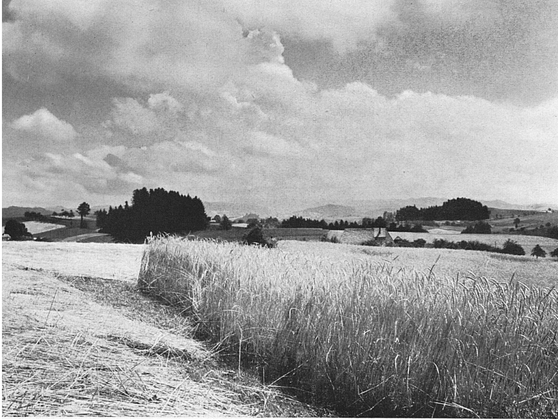
Bei Affoltern im Emmental* Près d'Affoltern dans l'Emmental Dintorni di Affoltern nell' Emmental