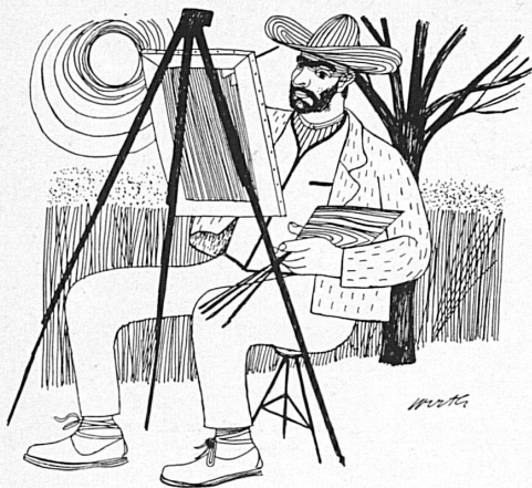
Zürich hat das Glück, die schönsten Werke aus der Reinhart-Sammlung noch bis Ende April in seinem Kunsthaus zu beherbergen