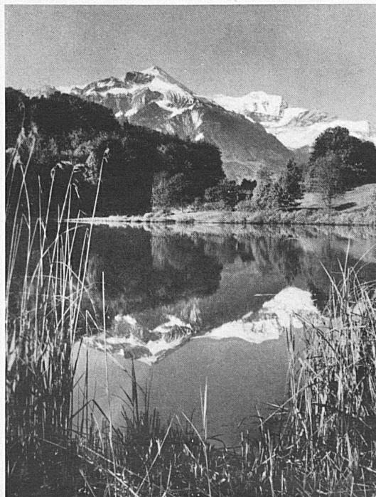
Rechts: Das Faulenseeli-Naturschutzgebiet bei Spiez* — Der Niesen vom Pilgerweg aus gesehen*. Seite rechts, Mitte: Der botanische Garten auf der Schynigen Platte*. Unten: Das Naturschutzgebiet Gwatt und die Berner Hochalpen*