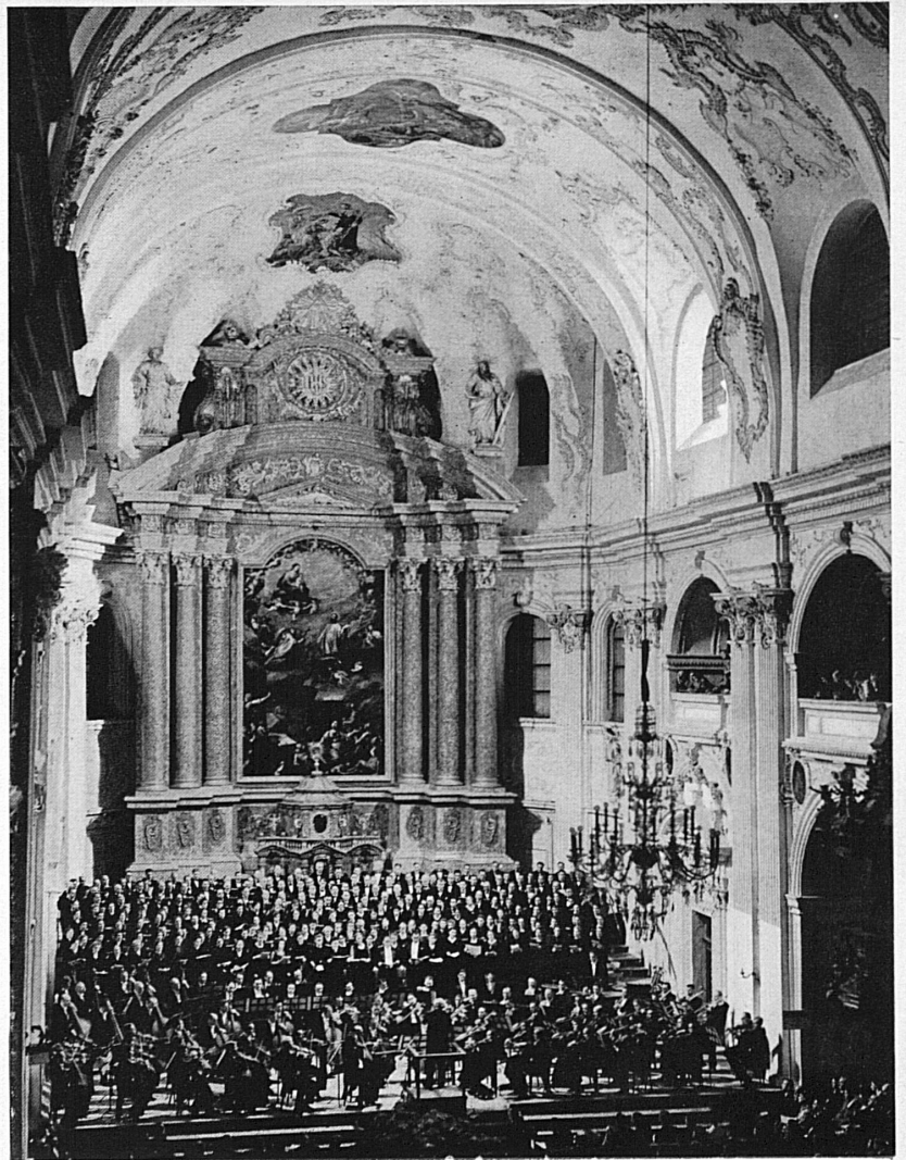
En haut: L'intérieur de l'église des Jésuites à Lucerne, où sera exécutée, le 4 septembre, la Missa solennis, de Beethoven. En bas: Walter Giesecking, Maria Caniglia, Ernest Ansermet, Antonino Votto, Paul Kletzki.