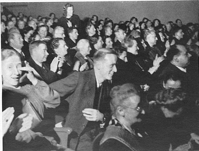
Das Publikum freut sich, freut sich von Herzen über den « Diener zweier Herren », der hier in des Wortes doppelter Bedeutung zweien Herren, sowohl der eigenen wie der gastgebenden Stadt, gleichermaßen dient. - Et les spectateurs se réjouissent de tout cœur des joyeuses péripéties de la comédie de Goldoni qu'ils ont le privilège de voir même loin de la métropole, grâce à cette tournée de représentations.

tigen zu tun; die Schauspieler müssen sich innert weniger Stunden von einem Klassiker auf ein modernes Lustspiel oder umgekehrt umstellen können. Und obendrein dürfen sie sich auf der Reise nicht erkälten.