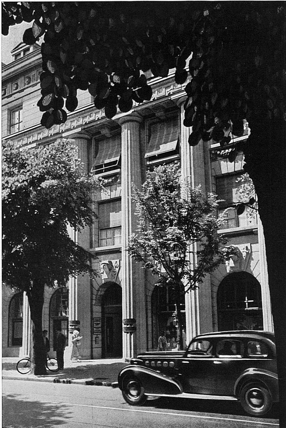
Eingang zum Bankgebäude in Zürich

Die mit * bezeichneten Aufnahmen behördlich bewilligt Nr. 6023 BRB 3. 10. 1939.