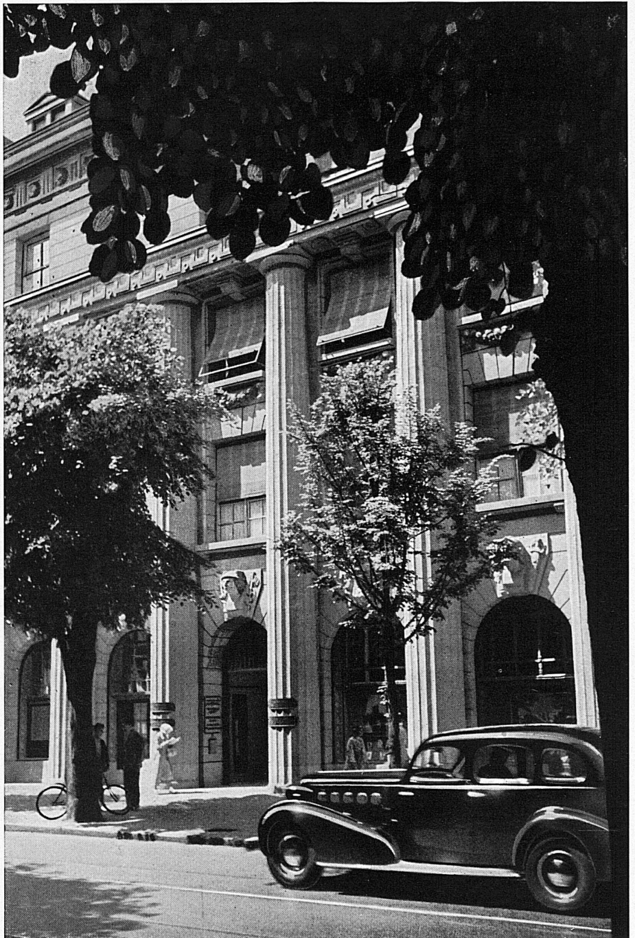
Eingang zum Bankgebäude in Zürich

Die mit * bezeichneten Aufnahmen behördlich bewilligt Nr. 6023 BRB 3. 10. 1939.