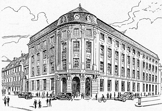
Bankgebäude in Basel — Hôtel de la banque à Bâle

☆ SCHWEIZERISCHER BANKVEREIN ☆ SOCIÉTÉ DE BANQUE SUISSE ☆ SOCIETÀ DI BANCA SVIZZERA ☆ SWISS BANK CORPORATION ☆