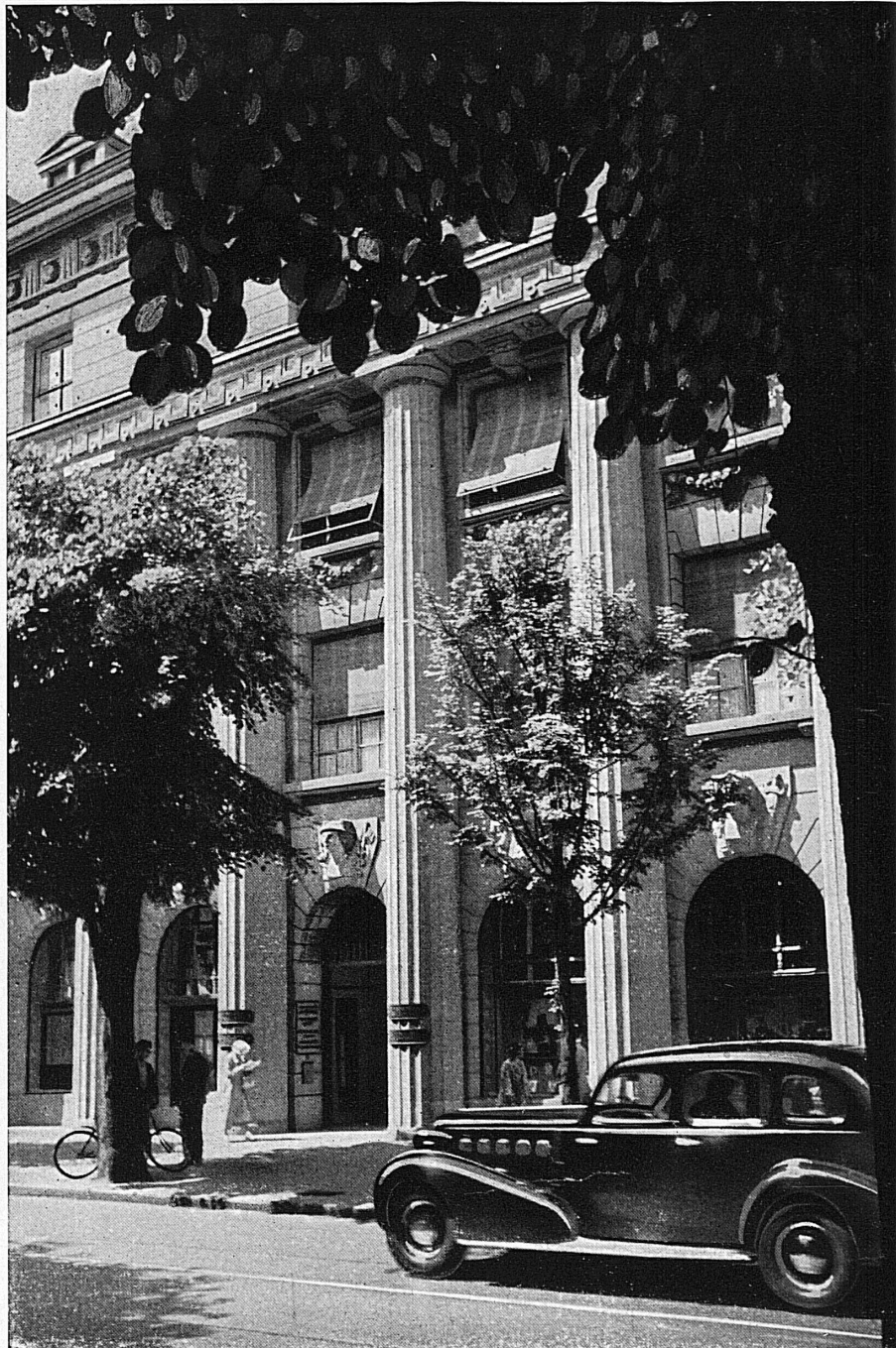
Eingang zum Bankgebäude in Zürich

Die mit * bezeichneten Aufnahmen behördlich bewilligt Nr. 6023 BRB 3. 10. 1939.