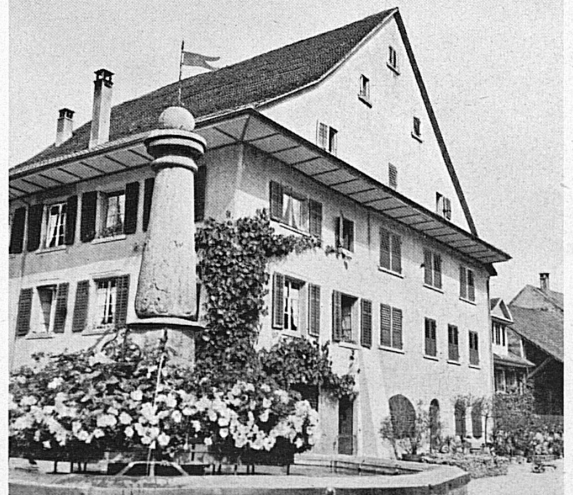
Rechts, von oben nach unten: Straßenbild aus Zurzach. — Ehemalige Stiftspropstei, heute Schulhaus. — Plastik vom Eingang eines der Messehäuser. — Motiv aus Zurzach.