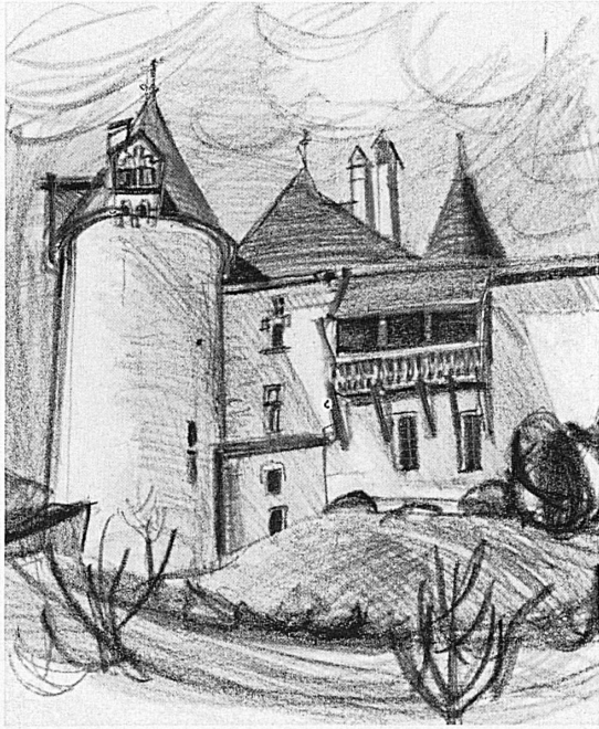
Il Castello di Gruyères. — Das Schloß Gruyères.

istoriati che testimoniano la purezza del pensiero cattolico attraverso i secoli. E poi ancora tutt' intorno a questa vita, a questo fervore ecco le antiche mura e le porte che chiudevano ed aprivano l'accesso alle vie del mondo. Dalla Porta di Zaehringen alla Porta del Bourguillon, dalla Porta di Berna a quella di Morat : tutto quanto è qui racchiuso ci parla del lontano passato e ci dice quanto esso fu attivo e severo. Gli abitanti di oggi, quelli che vivono nei vecchi quartieri del Borgo, dell'Auge, della Planche discendono dalla medesima razza dei costruttori morti da lungo tempo, quelli che avevano eretto e concepito questi santuari con fede primitiva e semplice, quelli che avevano ingentilito le piazze col canto delle fontane, quelli che avevano elevate queste mura austere. Razza dal carattere delineato e fermo, come vuole il luogo che è cupo e fiero, senza prospettiva e senza orizzonte. Chi vuol difatti vedere qualcosa del mondo bisogna che sorga dal baratro dove Fri-borgo antica è incassata; deve sorgere come fa il suo popolo oggi che per raggiungere le fabbriche e le officine, dove il lavoro lo attende, bisogna che si porti alla superficie, fuori dalle vecchie mura, dove la vita moderna ha preso il suo sviluppo. È infatti intorno all'antica cerchia, verso i colli di Gambach, della Vignettaz e di Pérolles che la città nuova si estende. Quartieri moderni, fabbriche e graziose contrade popolate di ville allegre e felici, animano oggi i