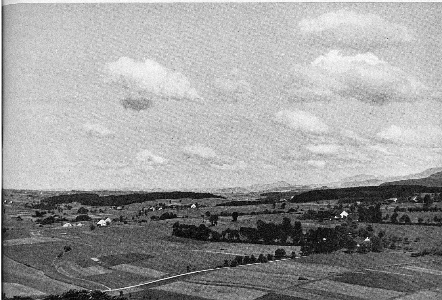
Nel Mittelland friborghese. — Im Freiburger Mittelland.*