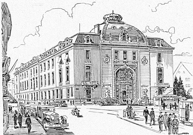
Bankgebäude in Zürich — Hôtel de la banque à Zurich

☆ SOCIÉTÉ DE BANQUE SUISSE ☆ ☆ SOCIETÀ DI BANCA SVIZZERA ☆ ☆ SWISS BANK CORPORATION ☆