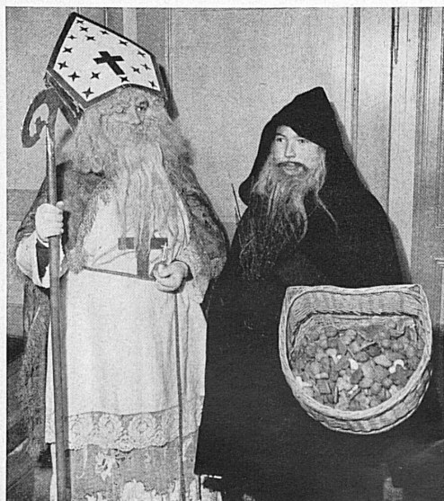
Oben: Hoch zu Roß zieht St. Niklaus im schwyzerischen Küßnacht ein. Links: St. Niklaus, im Gewand eines Bischofs gekleidet «Schmutzli», besucht die Häuser von Estavayer. Rechts: Auch im Rosenstädtchen Rapperswil erhalten die Kinder den Besuch der sie bescherenden Kläuse.

En haut: C'est à cheval que saint Nicolas fait son entrée solennelle à Küßnacht (Schwyz). A gauche: Coiffé de sa mitre d'évêque et accompagné du Père Fouettard de noir vêtu, saint Nicolas visite les maisons d'Estavayer. A droite: A Rapperswil, la cité des roses, les enfants reçoivent également la visite et les cadeaux de saint Nicolas.