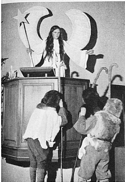
Links: Weihnachtliches Krippenspiel in Wettingen. Rechts: Der Engelschor beim Weihnachtsspiel von Sigriswil. Unten: Mutet dieses Bild vom traditionellen Weihnachtsspiel in der Kirche von Wettingen nicht wie die Wiedergabe eines alten Altargemäldes an?

A gauche: Représentation d'un mystère de Noël à Wettingen. A droite: Le chœur des anges dans le mystère de Noël de Sigriswil. En bas: Cette image du traditionnel mystère de Noël à l'église de Wettingen n'évoque-t-elle pas un vieux rétable?