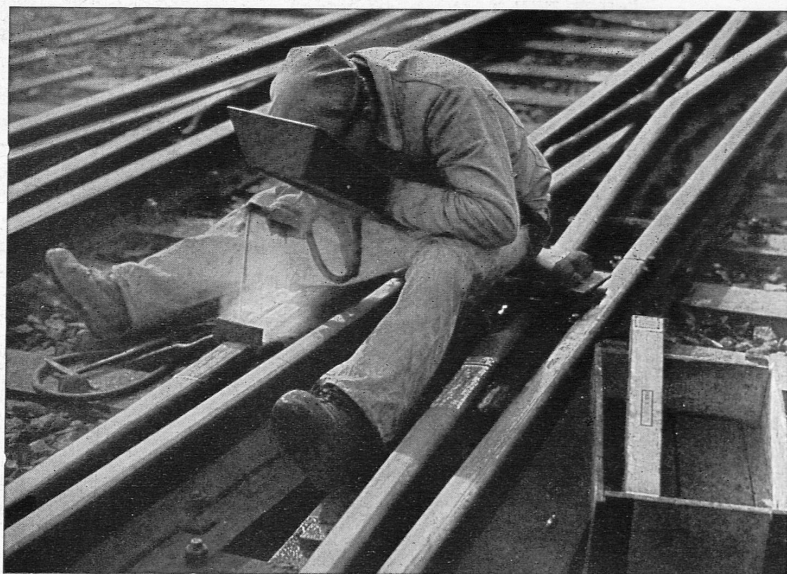
Unterhalts-Schweißarbeiten in einem SBB-Bahnhof