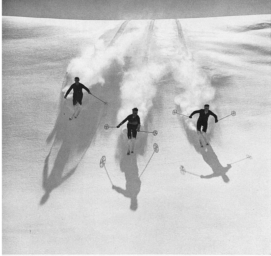
Seite links, oben: An den Schußhängen von Adelboden.* Unten: Hasliberg.* Seite rechts, oben: Schiltgrat-Skilift ob Mürren.* Unten links: Zwischen Grindelwald, Scheidegg, Wengernalp und Wengen liegt ein riesiges Skitummelfeld.* Unten rechts: Gstaad, Station der Montreux-Oberland-Bahn.