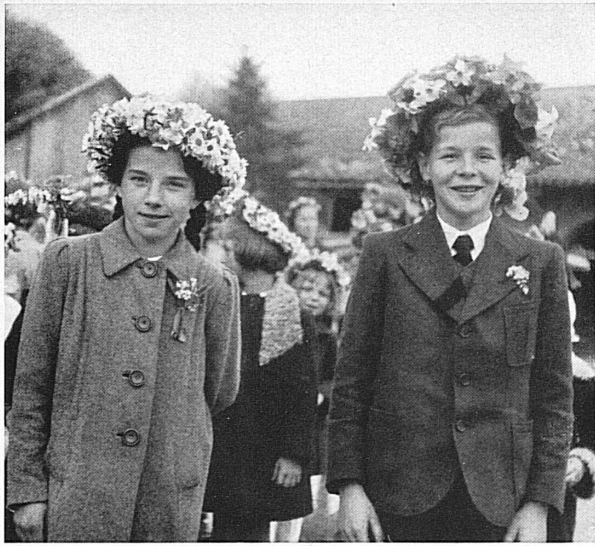
König und Königin — « Roi und Reine » — sind die Hauptpersonen am lieblichen Kinderumzug des « Feuillu » im genferischen Cartigny.

Le Roi et la Reine, principaux personnages du charmant cortège du « Feuillu » des enfants de Cartigny (Genève).