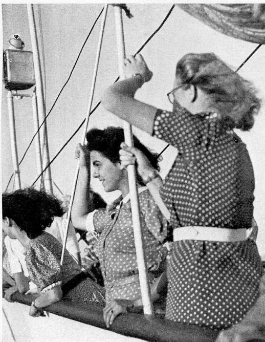
Auf dem Léman. Rechts: Das Schloß von Nyon.

Alle diese Veranstaltungen tragen zu jener besonderen Kursatmosphäre bei, in der sich jedermann wohl fühlt, weil alle mit der gleichen Aufgeschlossenheit und dem gleichen Ziel daran teilnehmen. Vor dem Krieg vereinigten die Ferienkurse mehrmals Französischlehrer und Studierende aus mehr als zwanzig verschiedenen Ländern: Australier, Japaner, Chinesen, Nord- und Südamerikaner, Perser, Ägypter, Vertreter der nordischen Länder und aus dem Balkan,