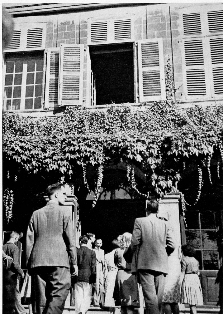
Auf Ausflügen und Exkursionen — hier nach dem Schloß Coppet — lernen die Studierenden die Gegend kennen und vertiefen so die gegenseitigen Freundschaften unter sich und mit den Professoren.

Der Erfolg der schweizerischen Kurse veranlaßte die Nachbarländer