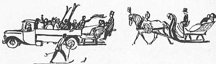
Zeichnungen von Robert Zuberbühler.

konnte innerhalb seiner kleineren Distanzen einen ge-regelten Schlittenbetrieb einrichten, der zwischen Davos-Platz und Davos-Dorf besteht und am Sonntag billig die Autobusse ersetzt. Aber was hier unter ganz besonderen Verhältnissen (es handelt sich um eine ebene und kurze Strecke) möglich war, war es andernorts nicht. Das Toggenburg hofft sich nun auf weite Sicht helfen zu können, indem es sich mit allen Mitteln für die geplante Ver-