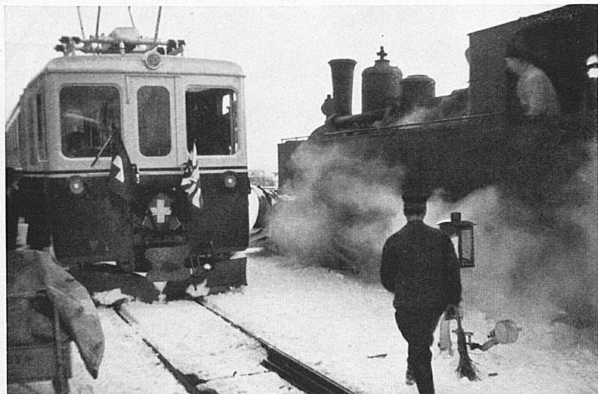
Le train électrique inaugural, orné de guirlandes, rencontre le vieux «vétéran» essoufflé. Die Begegnung des bekränzten elektrischen Einweihungszuges mit dem rauchenden alten «Choli».

L'évolution de Barraud depuis ses tout premiers essais jusqu'à ses plus récentes réussites, l'activité d'un artiste qui a dans tous les domaines de son art fourni les preuves d'un talent et d'une science également solides, c'est ce que nous montrera l'exposition de Genève, et l'on peut être assuré qu'elle rencontrera dans le monde des arts le plus grand intérêt. Ed. M.