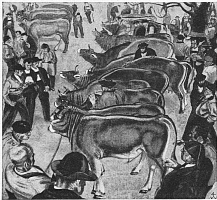
« Appenzeller Viehmarkt » 1919, von Sebastian Oesch. (Im Besitze des Kunstmuseums St. Gallen.)

bekannt, der eine eigene Note in unsere schweizerische Malerei brachte. Die präzise Form und kräftige lineare Begrenzung seiner hellen Farblflächen weisen auf Hodler hin, der realistische Einschlag und die