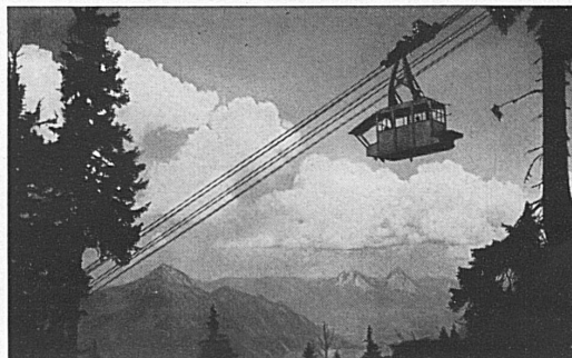
Luftseilbahn Beckenried - Klewenalp

Die beiden Internate für Knaben und Mädchen bieten häusliche Pflege und sorgfältige Erziehung