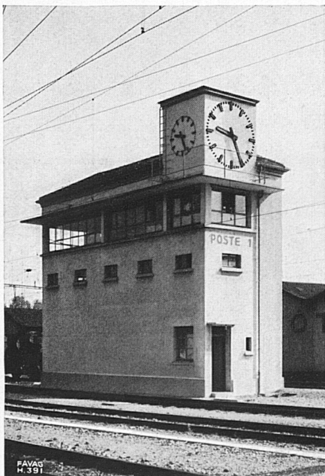
Horloges électriques d'un poste d'aiguillage

Das Kunstmuseum St. Gallen eröffnete am 10. März eine Ausstellung zum Gedächtnis des 1920 verstorbenen Malers Sebastian Oesch. An der Vernissage gab Walter Kern eine schöne Deutung der Entwicklung und des Wesens dieses eigenwilligen Künstlers. Der 1893 geborene und am 14. März 1920 an der Grippe gestorbene Maler hinterließ ein vielgestaltiges Werk, das hier zum ersten Male in diesem Umfang mit 71 Bildern und Pastellgemälden und einer großen Zahl von Studien und Skizzen gezeigt wird. Nach unruhigen Lehr- und Wanderjahren in Zürich, Paris, Algier, Berlin und Weimar kehrte der Künstler während des ersten Weltkrieges in die Schweiz zurück, arbeitete im Tessin und vor allem im Appenzellerland, wo er auch seine endgültige künstlerische Form in Verbindung mit dem appenzellischen Volkstum fand. Die Ausstellung macht mit einem Künstler