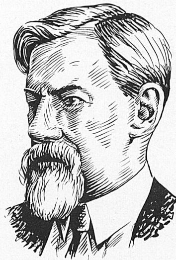
Edouard Claparède (1873–1940)

Die Ausbildung von Psychiatern und die wissenschaftliche Forschung sind in erster Linie die Aufgabe der sechs medizinischen Fakultäten der Schweiz. Ihr bedeutendster Vertreter auf dem Gebiete der Psychiatrie war Eugen Bleuler. Sein «Lehrbuch der Psychiatrie» ist weit über die Landesgrenzen hinaus bekannt und in verschiedene fremde Sprachen übersetzt worden. Die wissenschaftliche Tätigkeit findet ihren Niederschlag in einer Reihe von international bekannten Zeitschriften, vor allem dem «Schweizer Archiv für Psychiatrie», der «Monatsschrift für Psychiatrie» und der «Zeitschrift für Kinderpsychiatrie».