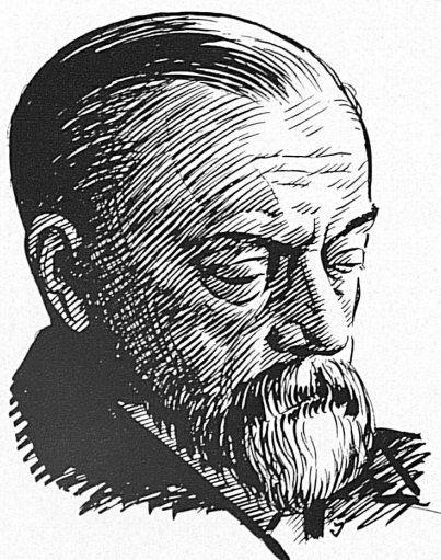
Paul Dubois (1848–1918)

reiche freipraktizierende Psychotherapeuten gibt, sondern daß — im Gegensatz zu andern Ländern — auch die klinische Psychiatrie die analytischen Methoden anerkennt und anwendet.