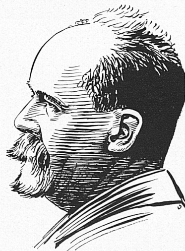
Théodore Flournoy (1854–1902)

Aber nicht alle psychisch bedingten Leiden sind einer Beeinflussung auf diesem direkten Weg, der sich an das Bewußtsein und den Gesundheitswillen des Kranken richtet, zugänglich. Häufig stehen unbewußte Wünsche und Befürchtungen im Wege, die der Kranke selbst nicht kennt und darum nicht überwinden kann. Auf diese kann der Arzt aber in der Hypnose einwirken. Die hypnotische Behandlung, die in Frankreich aufgekommen war, hat in der Schweiz Auguste Forel ausgebaut und ihr damit ihren Platz innerhalb der psychiatrischen Heilmethoden gesichert.