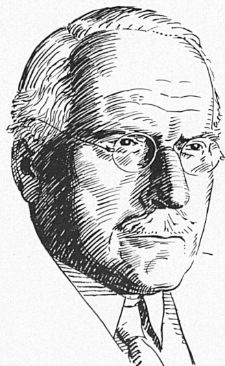
Carl Gustav Jung (geb. 1875)

Die Ausbildung zum Spezialisten ist durch die verbindlichen Vorschriften der Gesellschaft der Schweizer Ärzte geregelt. Der Titel eines Spezialarztes für Psychiatrie wird einem Arzt erst dann zuerkannt, wenn er sich nach absolviertem Staatsexamen während drei Jahren an einer psychiatrischen Klinik und während eines Jahres an einer medizinischen Klinik für seine Tätigkeit vorbereitet hat. Sämtliche Leiter der psychiatrischen Privatkliniken sind Inhaber des Spezialistendiploms.