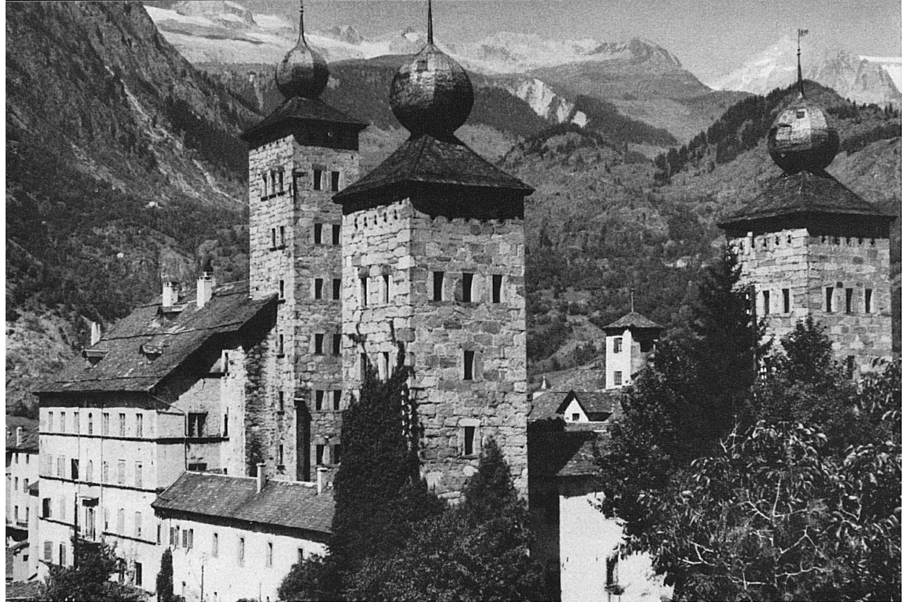
A gauche: Le palais Stockalper domine la petite ville de Brig. — Page à droite: Ernen dans la vallée de Conches; au fond le glacier de Fiesch. — Links: Der Stockalperpalast dominiert das Stadtbild von Brig. — Seite rechts: Ernen im Goms, mit dem Fieschergletscher.