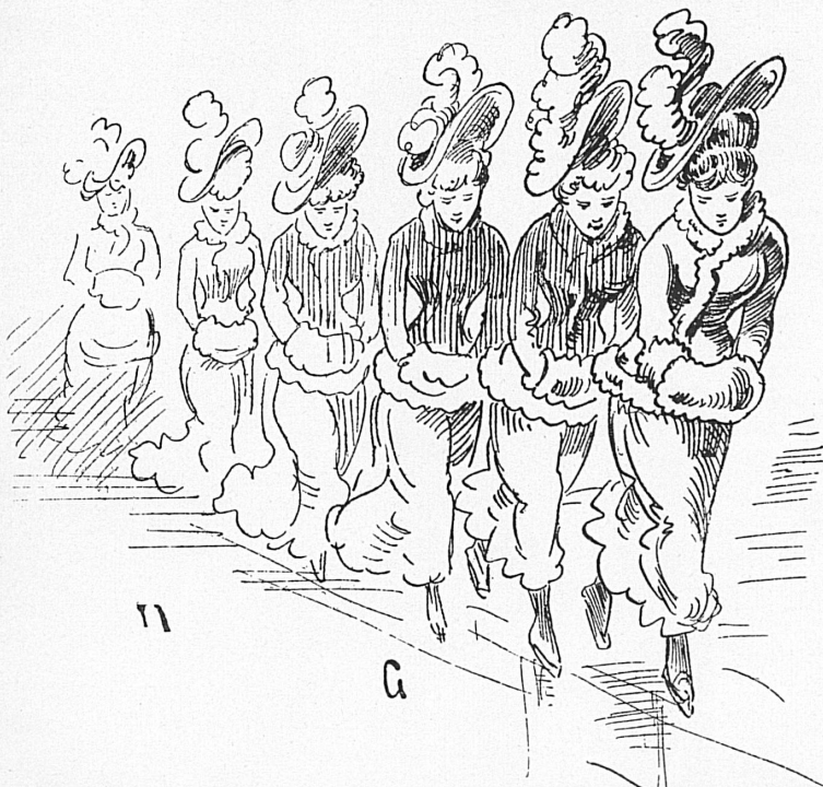
« Les patineuses », reproduites dans le « Nebelspalter » (XI me année, 1885). Schlittschuhläuferinnen, in Nr. 5 des elften Jahrgangs des « Nebelspalter » (1885).

Ce furent les Hollandais qui mirent en vogue, sur le