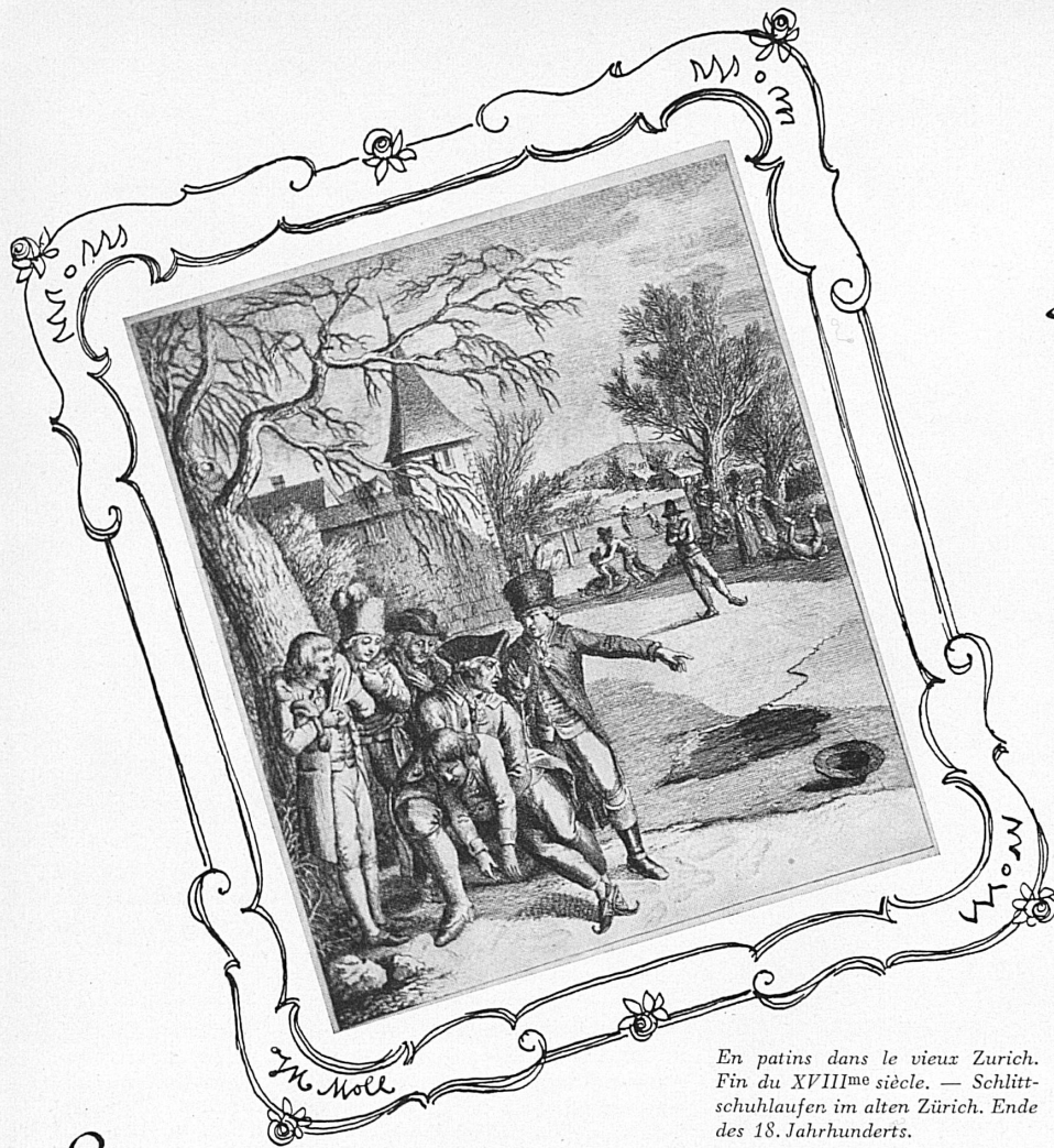
En patins dans le vieux Zurich. Fin du XVIII me siècle. — Schlittschuhlaufen im alten Zürich. Ende des 18. Jahrhunderts.