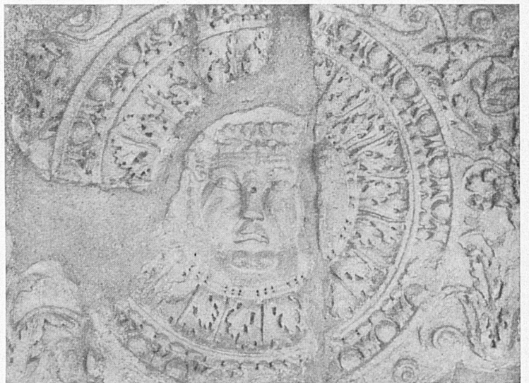
Vestiges de l'époque romaine à Avenches. — Reste römischer Altertümer in Avenches.