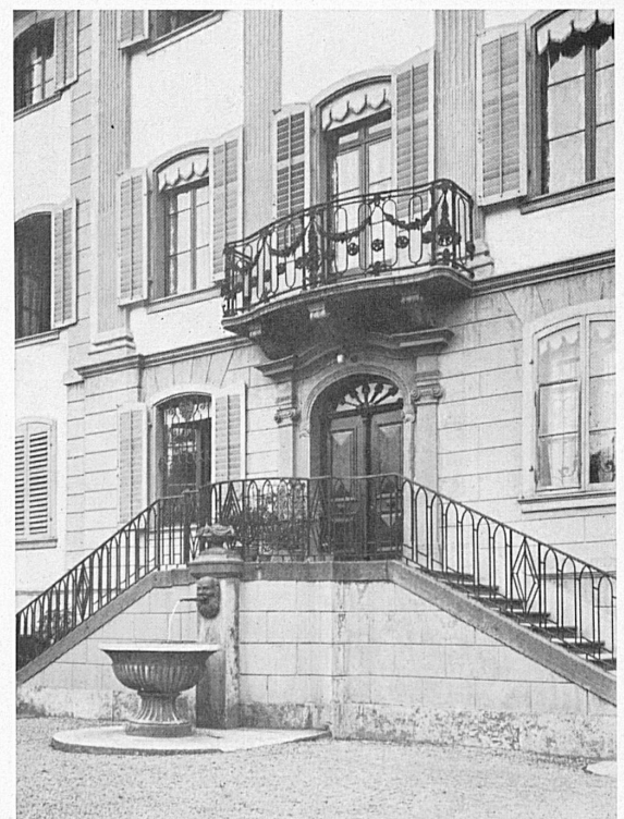
Unten: Eingangspartie des Herrschaftsgutes «Himmelrich». — En bas: Entrée de la campagne «Himmelrich» à Lucerne.