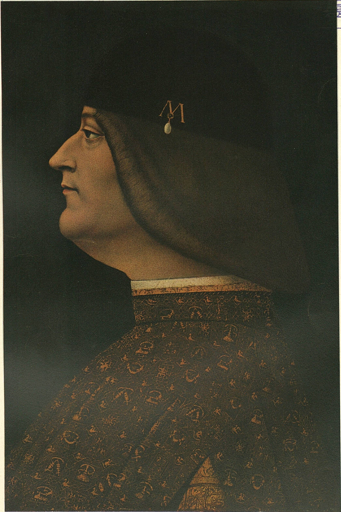
Bildnis des Lodovico Sforza, genannt il Moro, Herzogs von Mailand