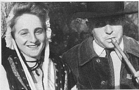
Costumes d'Avignon. Trachten aus Avignon.

La Saône avec ses vins aux parfums accentués de la Bourgogne, vins merveilleux que l'on déguste dans les festins où les tables sont chargées de mets, rejoint le Rhône à Lyon, la ville de la soie. Puis, le grand fleuve traverse des cités aux noms sonores: Valence, Avignon, et se jette dans la mer, entre des îles où broutent les taureaux à demi sauvages de la Camargue. Marseille est là, tout près, port immense, pour tout le pays