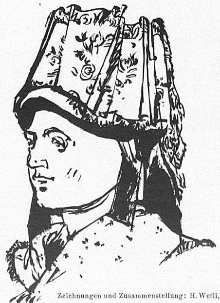
Zeichnungen und Zusammenstellung: H. Wetli, Genève.