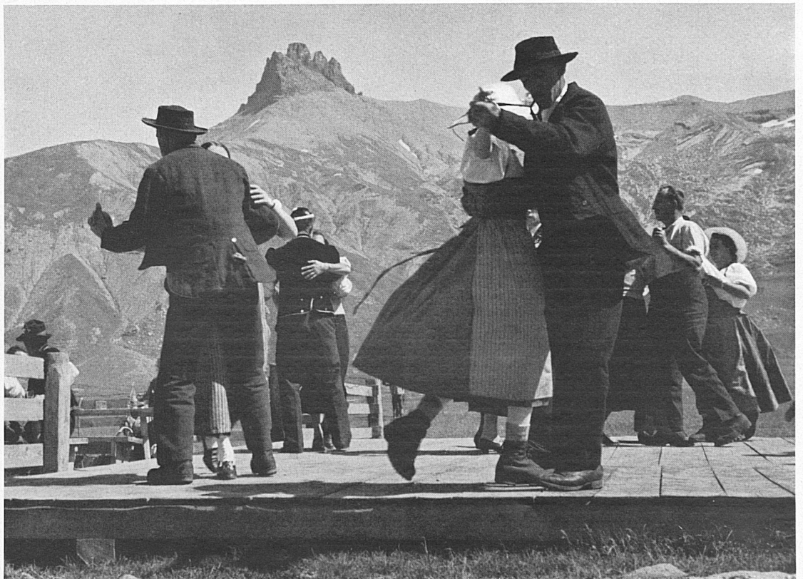
Rechts: « Bergdorfet » auf der Engstligenalp bei Adelboden. — A droite: La « mi-été » à l'Engstligenalp près d'Adelboden.

Auf das Fest soll auch der alte Unspunnen-Taler mit neuer Inschrift geprägt werden. Er kann bezogen werden: in Silber zum Preise von Fr. 5.— bei der Schweiz. Trachtenvereinigung, Heimethuus, Uraniabrücke, Zürich; in Gold (27 Gramm) zum Preise von Fr. 165.— bei der Bank Rüeegg & Co. AG., Fraumünsterstraße 15, Zürich 1.