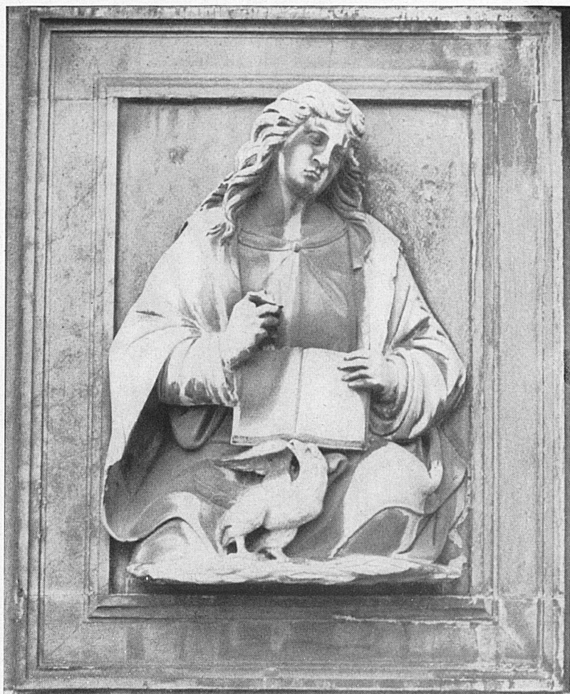
Relief an der Renaissance-Fassade der Kirche S. Lorenzo. — Bas-relief à l'église S. Lorenzo.