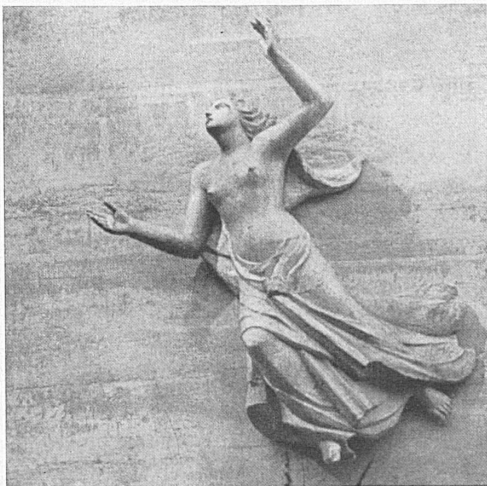
Plastik an der neuen Bibliothek. Sculpture moderne à la façade de la bibliothèque municipale.

Lugano zählt zu den Fremdenorten, die nicht erst mit der Entwicklung der Schweiz als Reiseland städtisches Gepräge angenommen haben. Dieses bildet seine alte kulturelle Basis. Seinen Kern schmücken bedeutende kirchliche und weltliche Bauwerke. Der lebendige Geist der Stadt zeigt sich alljährlich eindringlich an den künstlerischen Veranstaltungen der Messen-wochen. Weil die Fiera in die Zeit der Traubenreife und Winzerfeste fällt und so zum Vollklang herbstlicher Freuden auch der Ferienreisenden gehört, wird Lugano im Oktober ein schweizerisches gesellschaftliches Zentrum. Seine gegen 150 Hotels und Pensionen, seine Reisebüros haben jetzt eine gewaltige organisatorische Leistung zum Wohl der Gäste zu vollbringen. In Ihrem eigenen Interesse liegt es, wenn Sie Ihr Zimmer zeitig vorausbestellen. Und sollten Sie in Lugano selbst keine Unterkunft mehr finden, so dürfen Sie sich darauf freuen, in seiner Umgebung unterzukommen. Denn das Umland der Stadt ist herrlich, und Bahnen, Autocars und Schiffe führen Sie rasch ins Zentrum des Ferienbetriebes.