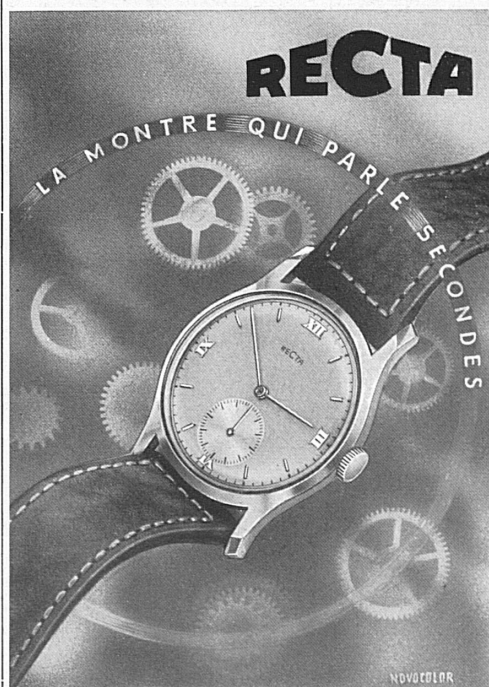
RECTA Manufacture d'Horlogerie S.A., Bienne