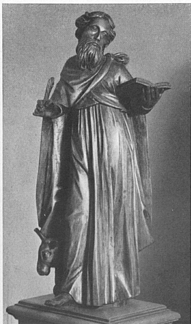
Links: Skulptur des Evangelisten Lukas in der Pfarrkirche Kriens (17. Jahrh.). A gauche: Sculpture de l'évangéliste saint Luc dans l'église paroissiale de Kriens (XVII me siècle).