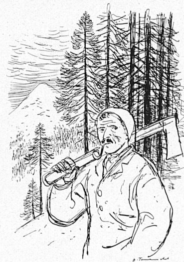
Zeichnungen von Hans Tomamichel.

Dazu aber bedarf sie namhafter Mittel. Deshalb ergeht der Ruf ans Schweizervolk: Helft mit, soviel in euren Kräften liegt, die