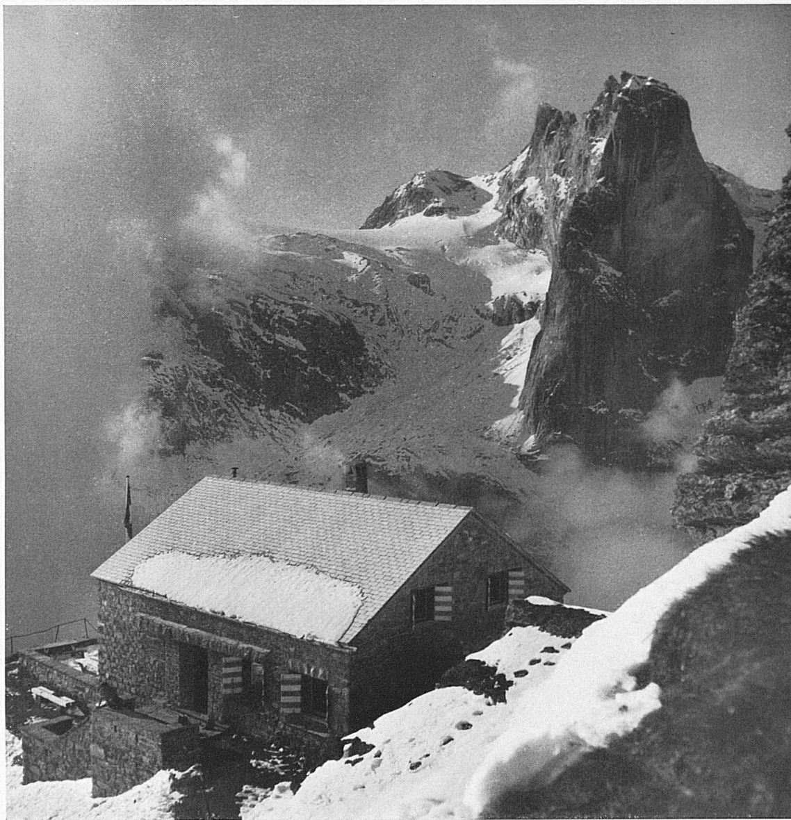
Seite links: Frühlings-Skifahrt am Säntis. — Oben: Die Hüfi-hütte des S.A.C. im obern Maderanertal. Blick auf den Kalkschyen. — Page de gauche: Ski de printemps au Säntis. — En haut: La cabane de Hüfi du C. A. S. dans la partie supérieure du Maderanertal. Vue sur le Kalkschyen.

Sag', kommst du mit uns, Skikamerad? W. Z.