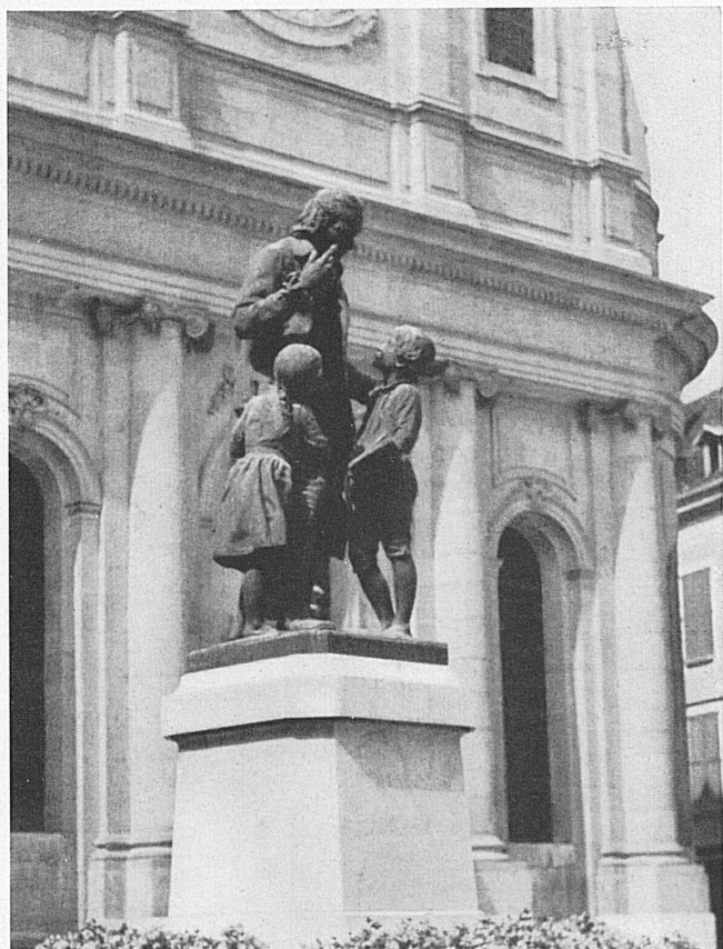
En haut: Dessin de Pestalozzi d'Albert Anker, d'après un tableau de Bodenmüller. — A gauche, en bas: Le monument de Pestalozzi devant le Château d'Yverdon.

Lamoni e del Fontana di vivificare con essa le scuole ticinesi e lombarde del loro tempo, non c'è dubbio che avrebbe errato di molto... È stato detto che a un'idea giusta occorrono cento anni per essere scoperta, cento anni per essere compresa, e altri cento per essere realizzata. I cento anni necessari per riuscire a comprendere la pedagogia pestalozziana sono trascorsi. Ora è cominciata l'ultima fase, la fase della realizzazione. Auguriamo che cento anni siano di troppo per creare la scuola dell'autoeducazione, la scuola anti-verbalistica promotrice della humanitas, la scuola incontro e celebrazione di due spontaneità, quella degli allievi e quella del maestro, ideale educativo del grande discendente della ticinese Maddalena Muralti.