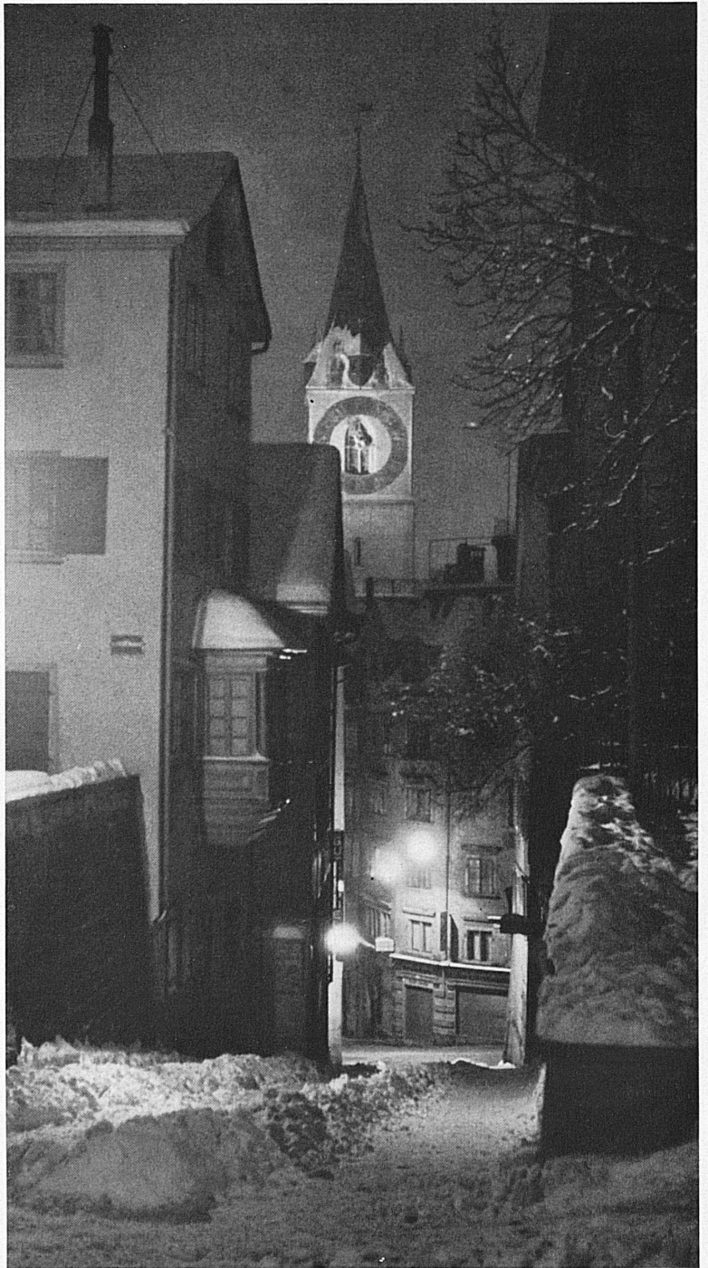
Oben: In der Zürcher Altstadt. — Links: Lebendmaske von Pestalozzi, angefertigt zirka 1809 (Pestalozzianum Zürich).