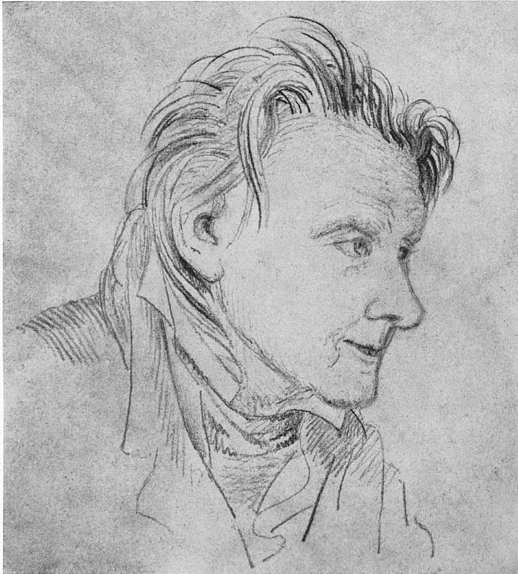
Der alternde Pestalozzi, Zeichnung von Karl Schulthess, 1825 (Pestalozzianum Zürich).