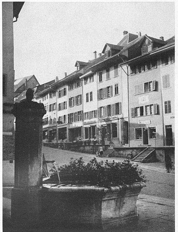
Die Hauptgasse in Brugg mit dem Hause des Arztes Dr. F. A. Stäbli, wo Pestalozzi am 17. Februar 1827 starb. — La rue principale de Brugg avec la maison du médecin F.-A. Stäbli, dans laquelle Pestalozzi mourut le 17 février 1827.