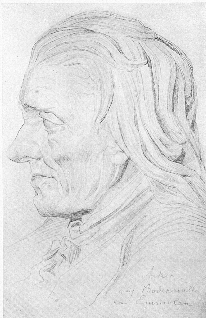
Oben: Zeichnung Pestalozzis von Albert Anker, nach einem Bild von Bodenmüller, aus der Yverdoner Zeit. — Links unten: Das Pestalozzi-Denkmal vor dem Schloß in Yverdon.

Se per ispirito di Pestalozzi, Luigi Imperatori intendeva la sollecitudine per l'educazione dei fanciulli, diceva bene; ma se avesse inteso l'esatta e diretta conoscenza della concezione pedagogica pestalozziana e la ferma volontà del Soave, del Bagutti, del Franscini, del