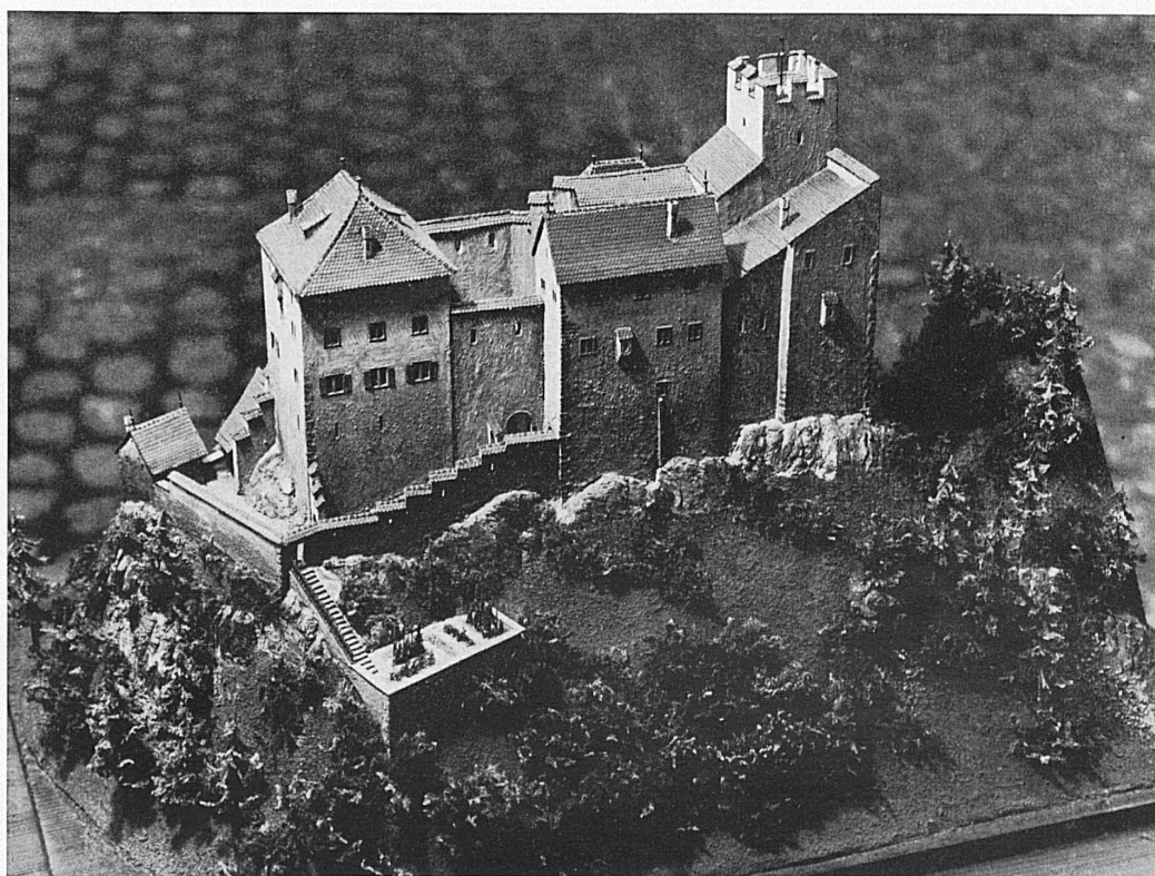
Modell des Schlosses Waldenburg (Basel-Land). — Maquette du château de Waldenburg (Bâle-Campagne).